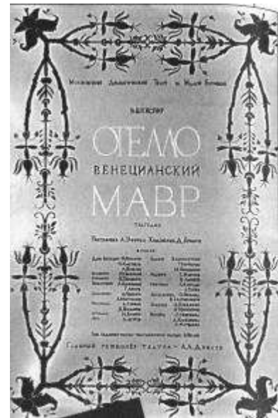
Рисунок 26 Афиша и макет декорации спектакля. Художник Д.Крымов. 1976