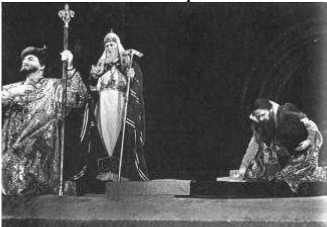
Рисунок 11 "Борис Годунов" А.Пушкина. 1957

«В детском театре была какая-то особая, чистая и сеселая обстановка...»