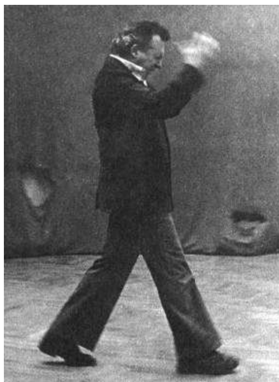
Рисунок 255 Репетиции Отелло

«Шекспир требует прозрачной психологии, несмотря на весь свой темперамент...»