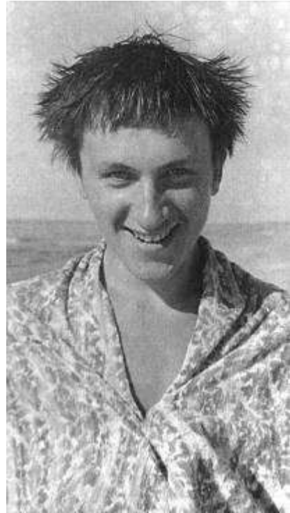
Рисунок 10 Как художник-сценограф Дмитрий Крымов поставит с А.Эфросом двенадцать спектаклей

«В детском театре была какая-то особая, чистая и сеселая обстановка...»