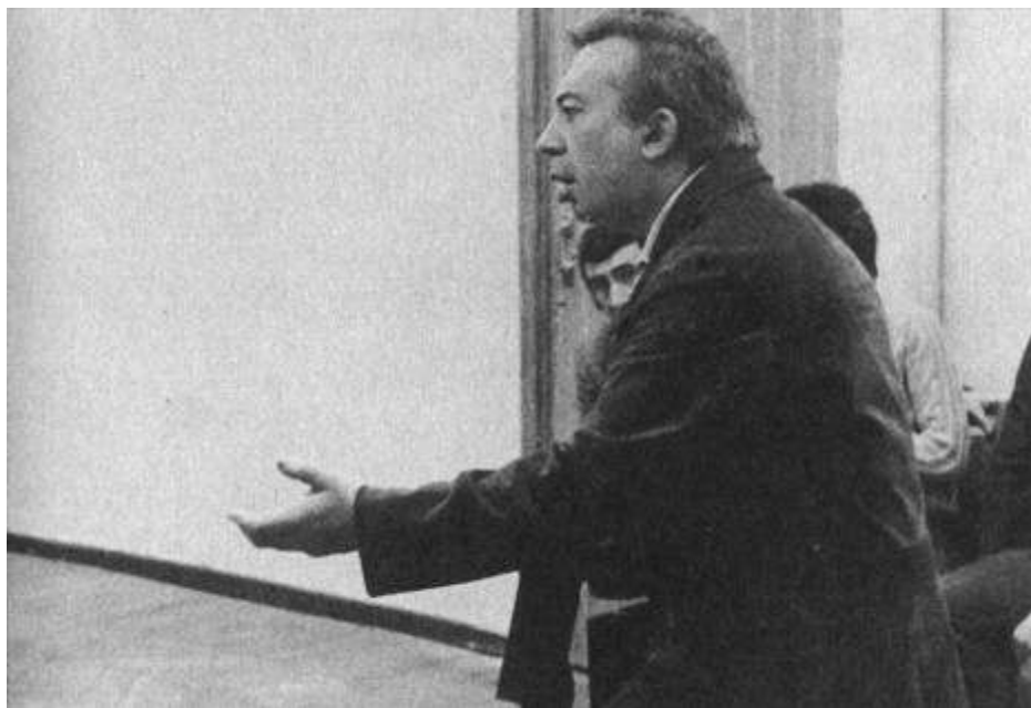
Рисунок 23 Репетиции Отелло