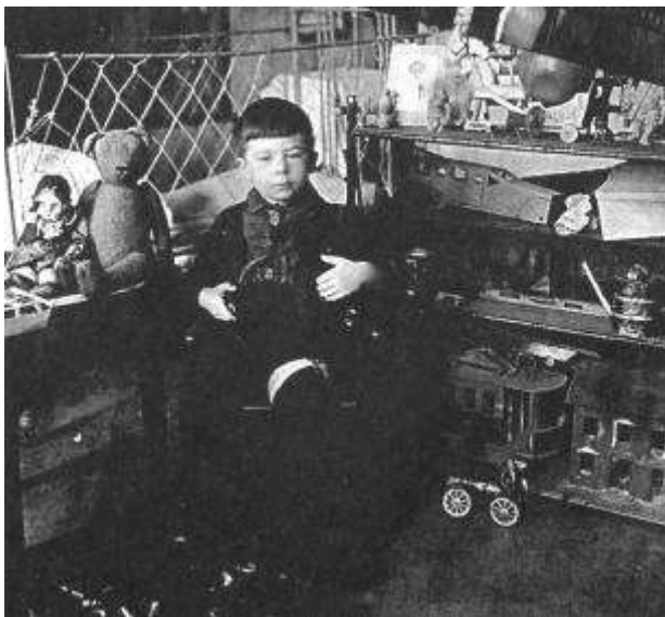
Рисунок 4 Детство