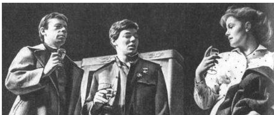
Рисунок 17 "Мой бедный Марат" А.Арбузова. 1965