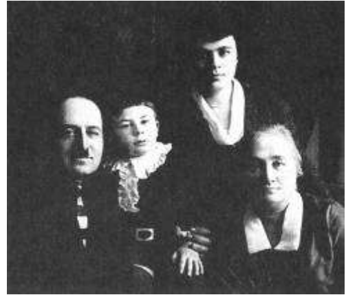
Рисунок 5 С мамой, дедушкой и бабушкой. 1929