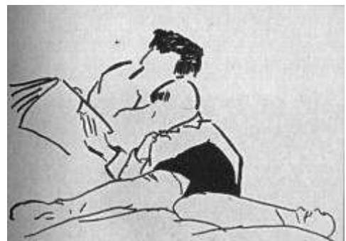
Рисунок 8 Отец и сын. Рисунок Н.Крымовой. 1958