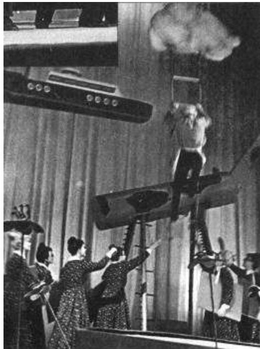
Рисунок 14 "Цветик-семицветик" В.Катаева. 1962

«После Центрального детского был Театр имени Ленинского комсомола. Эти три года кажутся мне самыми горячими, самыми азартными. Чтоб попасть в наш театр, публика не раз ломала двери...»