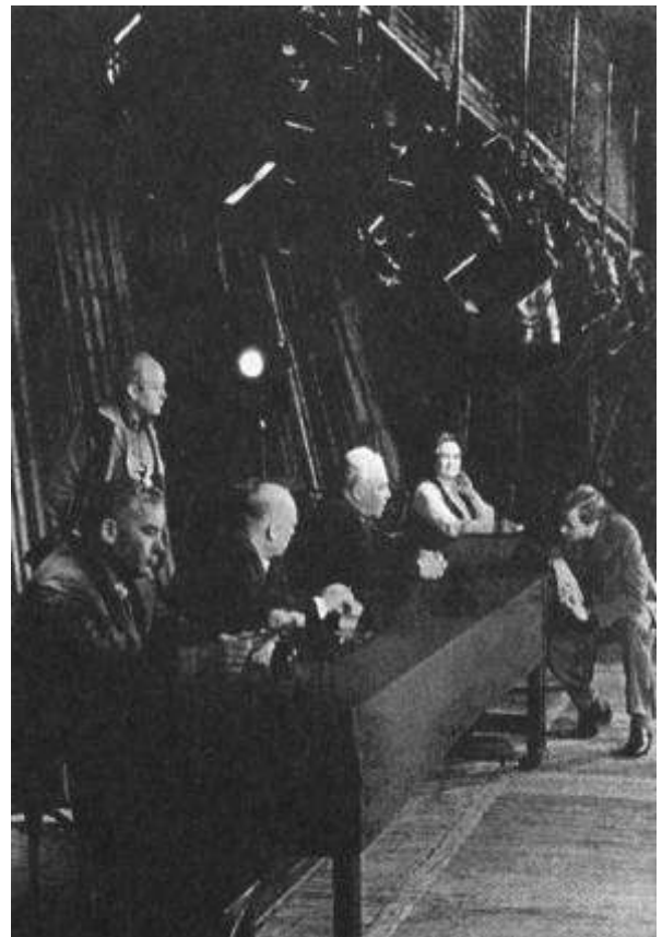
Рисунок 35 "Человек со сотроны" И.Дворецкого