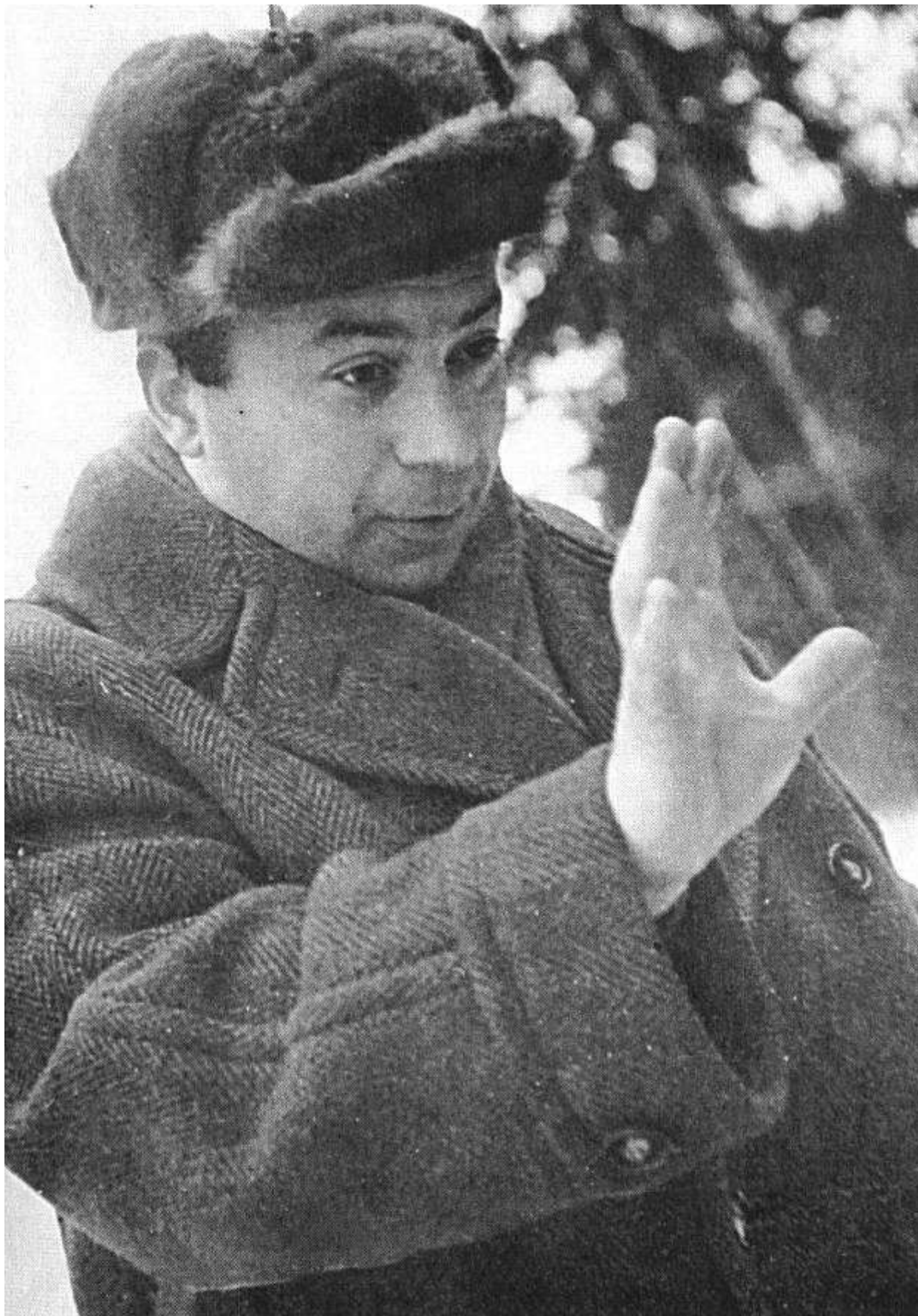
Рисунок 1 Эфрос