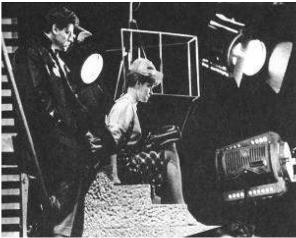
Рисунок 18 "Снимается кино" Э.Радзинского. 1965