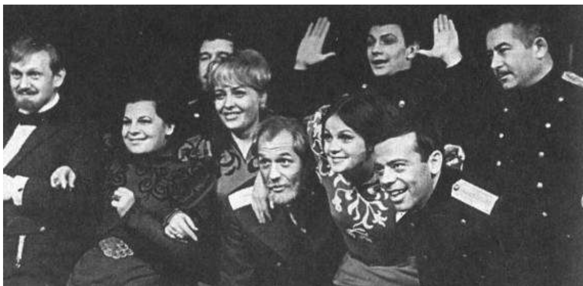
Рисунок 28 "Три сестры" - трагичнейшая из пьес..."