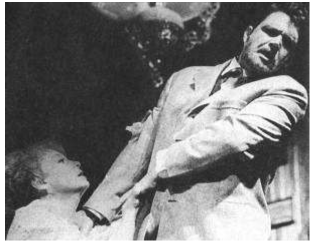
Рисунок 19 "Чайка" А.Чехова. 1966

«И вот мы попали на тихую маленькую улочку, которая так и называлась – Малая Бронная. Там я проработал почти семнадцать лет...»