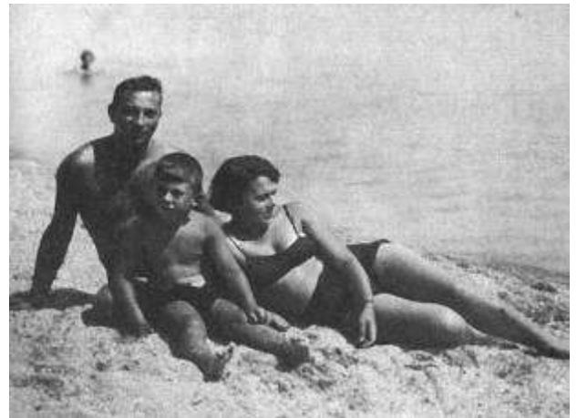
Рисунок 6 С родителями на юге.