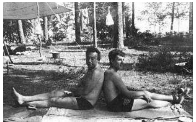
Рисунок 7 "Прекрасная вещь - свобода" С сыном на отдыхе