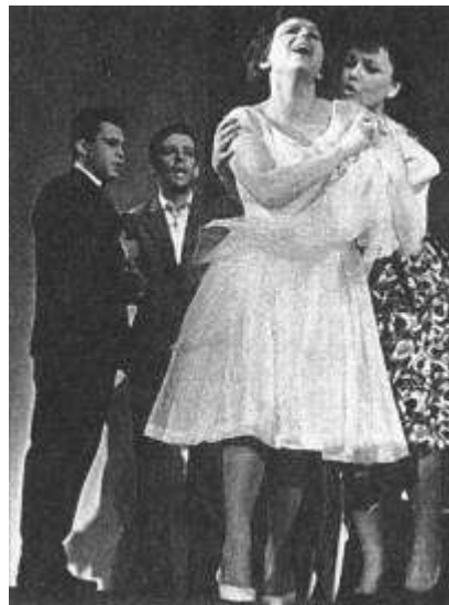
Рисунок 16 "В день свадьбы" В.Розова. 1964