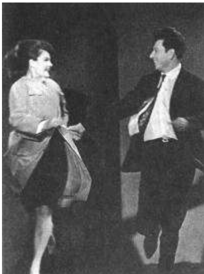
Рисунок 15 "104 страницы про любовь" Э.Радзинского. 1964

«После Центрального детского был Театр имени Ленинского комсомола. Эти три года кажутся мне самыми горячими, самыми азартными. Чтоб попасть в наш театр, публика не раз ломала двери...»