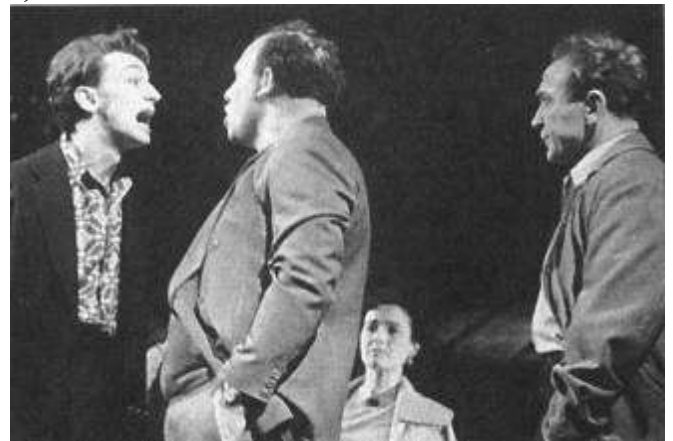
Рисунок 12 "В поисках радости" В.Розова. 1957